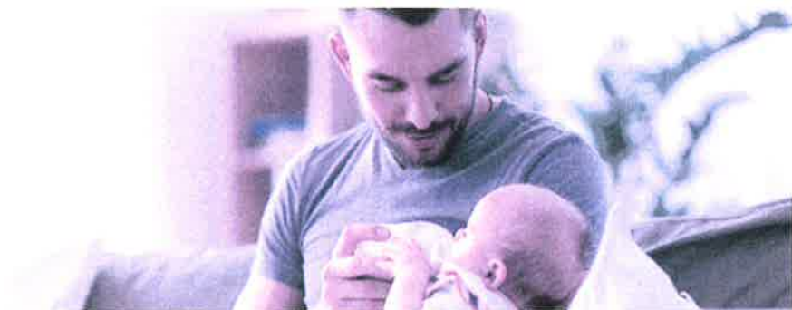
Vaterschaftsurlaub: innert sechs Monaten nach der Geburt zu beziehen.

Das Unternehmen muss dem Vater zehn arbeitsfreie Tage gewähren und hat für diese Zeit Anspruch auf 14 Taggelder. Es ist Sache des Arbeitgebers, bei der Ausgleichskasse – welche auch die EO-Beiträge abrechnet – den Antrag auf die Vaterschaftsentschädigung zu stellen. Der Antrag sollte aber erst gestellt werden, wenn der Arbeitnehmer den ganzen Vaterschaftsurlaub bezogen hat und der Arbeitgeber dies mit dem Antrag bestätigen kann. Die Auszahlung der Vaterschaftsentschädigung erfolgt dann nachgelagert