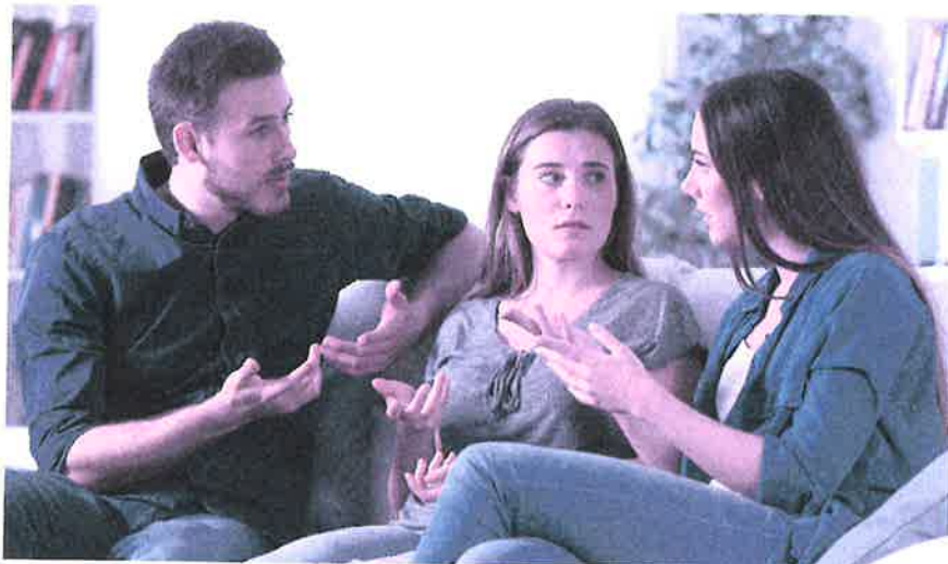
Kommt es zum Streit zwischen den Erben, muss der Willensvollstrecker schlichten.

Der Willensvollstrecker setzt den letzten Willen des Erblassers um. Dafür stellt er als Erstes ein Inventar auf, das er laufend nachführt. Er verwaltet die Erbschaft bis zur Teilung und muss darauf achten, dass das Vermögen erhalten bleibt. Er bezahlt die Schulden des Erblassers inklusive der Todesfallkosten und treibt offene Forderungen ein. Zur Verwaltung gehören auch die laufenden Geschäfte, beispielsweise muss er sich um den Unterhalt von Liegenschaften kümmern, laufende Verträge kündigen oder allenfalls die Liquidation einer Einzelunternehmung umsetzen. Er ist verantwortlich für die Erstellung der